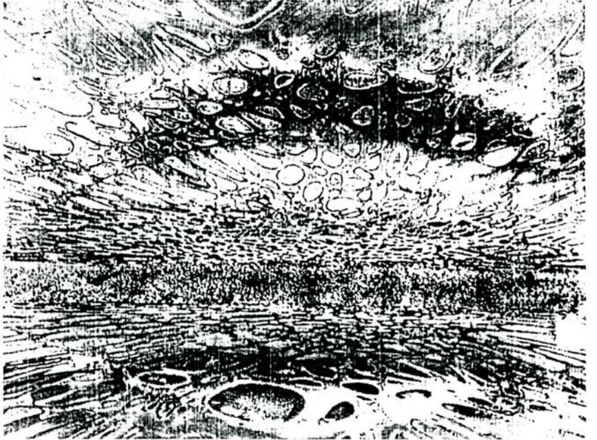
कृष्णा रेड्डी • अनामिक • मुद्राचित्र

“मुलांनो, आता आपला प्रवास संपत आला.” कॅप्टन गोम्सने घोषणा केली. “स्पेस-स्टेशनचे कर्मचारी येऊन तुम्हांला हातानं धरून आत नेतील. शून्य गुरुत्वाकर्षणात राहण्याचा हा तुमचा पहिला अनुभव. तुम्हांला मजा वाटेल, पण फार उड्याबिड्या मारू नका. उद्या तुम्हांला अंतराळयानातून चंद्रावर नेऊन आणण्यात येईल आणि मग परत पृथ्वीवर याच शटलनं तुम्हांला पोचवण्यात येईल. मात्र त्या वेळी मी इथं नसेन. माझे मित्र कॅप्टन मेहरा शटल चालवतील. तेव्हा मी आता तुमचा निरोप घेतो.”