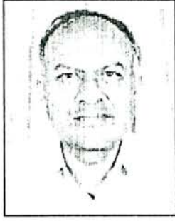
डॉ. जयंत नारळीकर