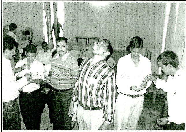
RVSPS supported workshop in progress for training resource persons in demonstrating science behind so-called miracles

चमत्कारों का असली रूप दिखाना और अंधविश्वासों से लड़ना भारत की अपनी विशेष समस्याएं हैं। तथाकथित धर्मगुरु विज्ञान को लगभग चुनौती देते हुए चमत्कार दिखाकर भोलीभाली जनता का फायदा उठाते हैं और व्यक्तियों एवं समाज पर अत्याधिक बुरा प्रभाव कर सकाते हैं। वैज्ञानिक और जादूगर मिलजुल कर ऐसे मामलों के असल रूप को सामने लाकर महत्वपूर्ण भूमिका अदा कर सकते हैं। पत्रिकाएं इनसे अच्छी कहानियां प्राप्त कर सकती हैं।