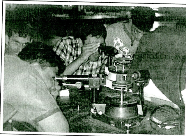
Students engrossed in a laboratory experiment

Thanks to the way science is taught in our schools, a typical student looks upon it as a mysterious subject which is to be memorised by heart and reproduced ditto, much as a parrot trained to speak words and sentences does. None of the thrills of science, the agonies of unsolved problems, the ecstasies of finding the right solutions, etc., are conveyed to him or her. So the school children grow into adults who are happy to be relieved of the burden of science. It is something they were made to learn at school and are now glad to leave behind.